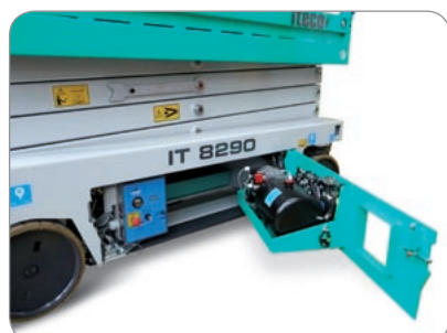
Wartungsfreundliche Bauteile mit rationellem Einbau.