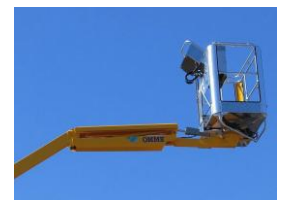
Fly Jib (Option)